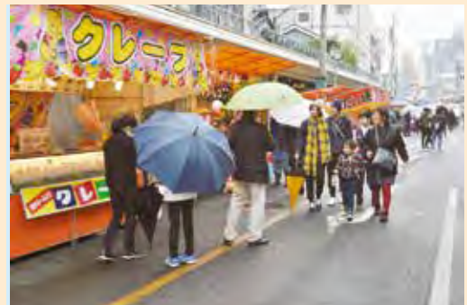
▲8,000人が来場した鹿屋市秋まつり

また、夜には新酒まつりが開催され、約1,500人の方々が来場。昼夜を通して大盛況のうちに終了することができました。