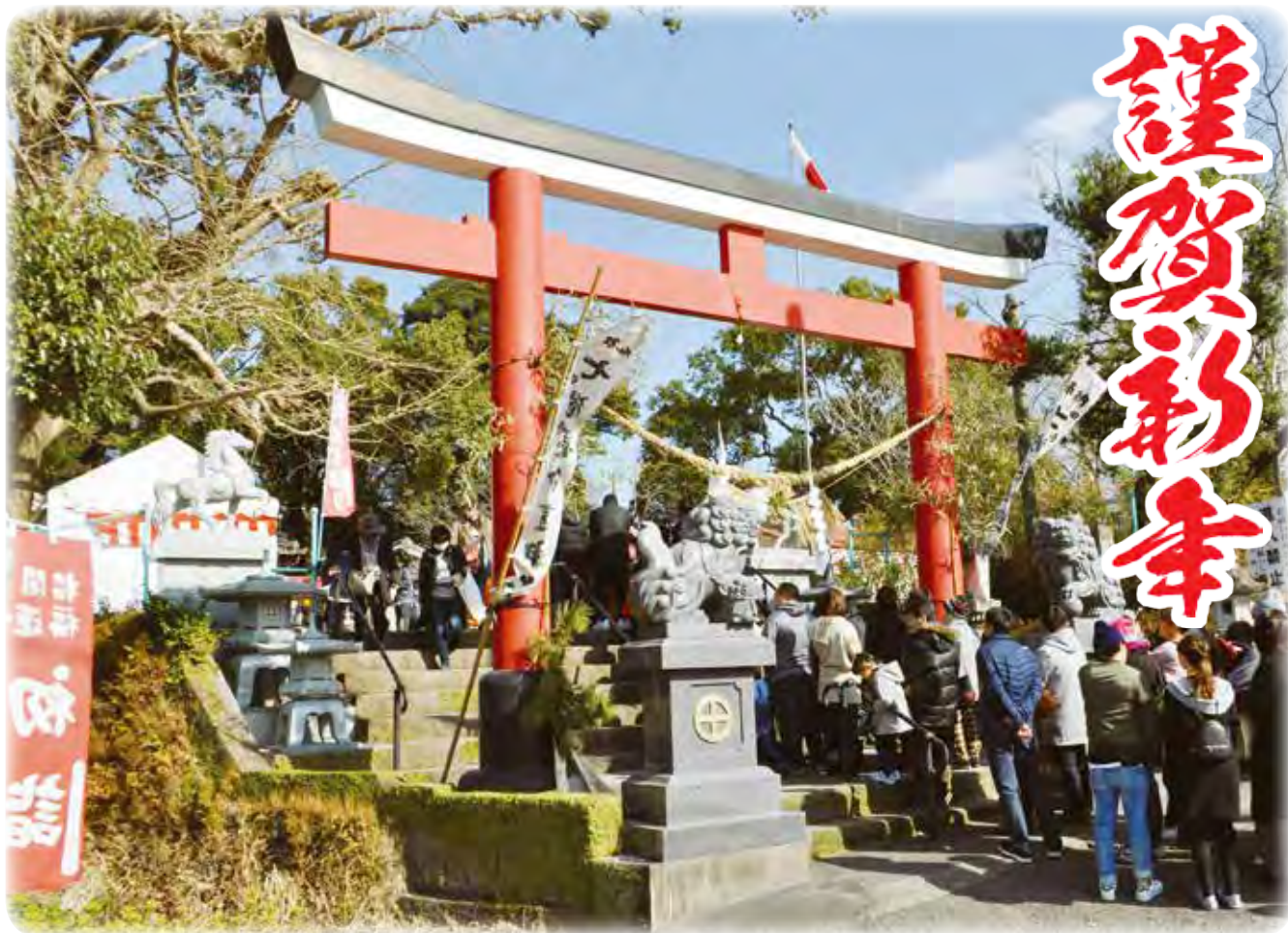
▲元日 初詣の参拝客でにぎわう田崎神社