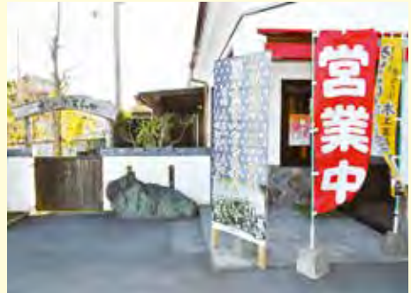
▲10月20日にグランドオープンしたきこりギャラリー