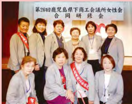
▲研修会に参加した女性会メンバー

今回の研修で学んだことを、女性ならではの視点や感性で地域の発展に反映させたいと感じさせられた合同研修会でした。