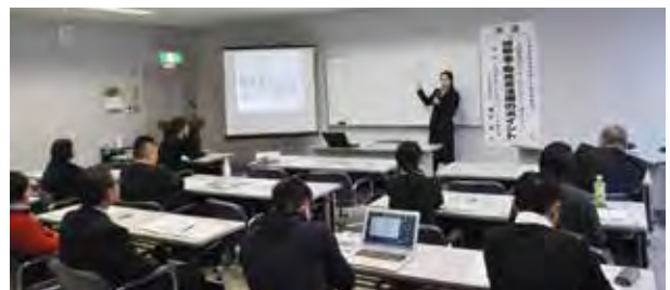
▲「補助金・助成金」のポイントを学ぶ参加者

そして、平成31年10月の消費税率10%に併せて導入される予定の軽減税率に備え、国では『軽減税率対策補助金』を設け支援を行っている。複数税率対応レジ導入や受発注システムの改修等に活用できる点、またレジ導入補助金を例に、申請のポイント等について解説されました。