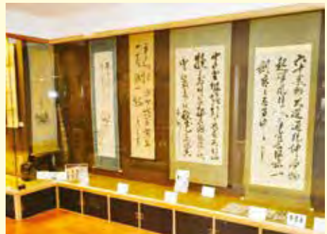
▲右から2番目が西郷隆盛の書