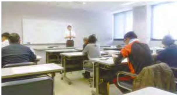
▲経営計画作成支援セミナー

参加者からは、「経営計画の作成に向けて、継続的な支援を受けたい」、「持続化補助金などの申請を目指したい」などの声もあり、熱心に聴講していました。