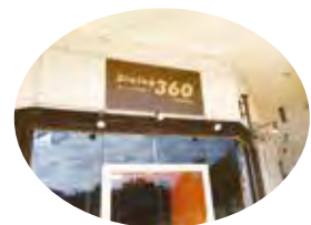
▲昨年オープンした店舗