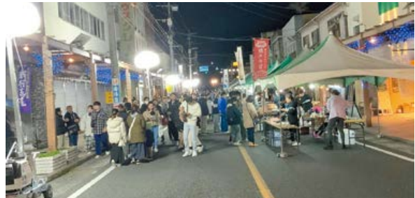
▲夜の部：北田商店街地区の様子