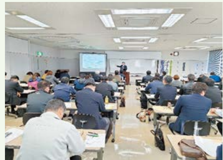
▲熱心に聞き入る受講者

受講者の方々は、熱心に聞き入っており、「初心者にもわかりやすい内容だった。」「実際に業務の中で活用してみます。」などの声が上がりました。