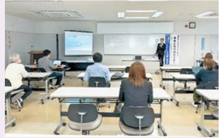
▲熱心に聞き入る受講者

受講者の方々は、実際に自分のパソコンやスマートフォンでプロンプトを作成し、便利さを実感している様子で、事業計画書の作成のみならず、自社の事業に役立てたいとの声が上がりました。