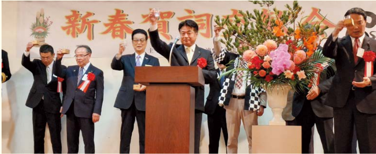
▲乾杯の発声を行う新屋会頭

1月6日（月）にホテルさつき苑にて、新春恒例の「新春賀詞交歓会」が各種団体連絡協議会の主催で開催され、大隅地域の各団体・事業所・行政関係者など61団体より362名が参加しました。