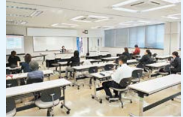
▲セミナーの受講者の様子

受講者からは「今まで利用したことがない SNS について特徴を知ることができた」、「初めて知る内容もあり、今後の SNS 運用に活かしていきたい」などの感想が聞かれました。