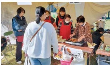
▲イカ焼きを販売する女性会会員