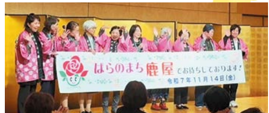
▲地元アピールを行う当所女性会会員