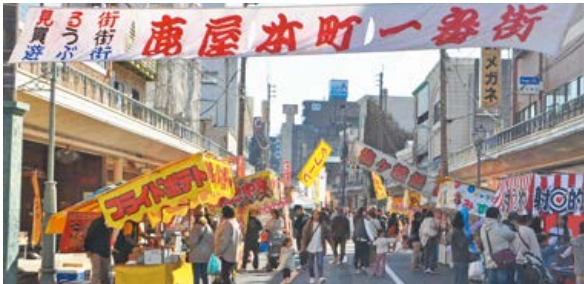
▲昼の部：本町商店街地区の様子

また、夜の部では、北田商店街地区にて「北田わかだいしょう焼酎まつり」、本町商店街地区にて「夜の飲食広場」のイベントが開催され、焼酎の振る舞いの他、バンド演奏などの催し物も行われ、昼夜を通して盛況のうちに終了しました。