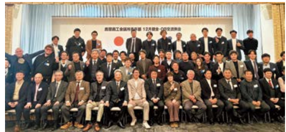
▲全体での集合写真