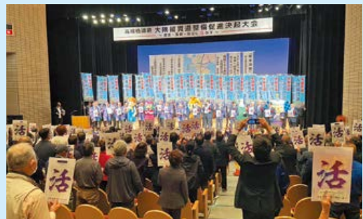
▲ 500名の参加者によるがんばろう三唱

大隅縦貫道は一部が開通しているものの、依然として供用開始時期が未定の区間や整備時期が決まっていない区間が多くあることから、産業の発展や医療・防災の観点からも早期の開通へ向けて、引き続き要望活動を行うために改めて思いをひとつにした大会となりました。